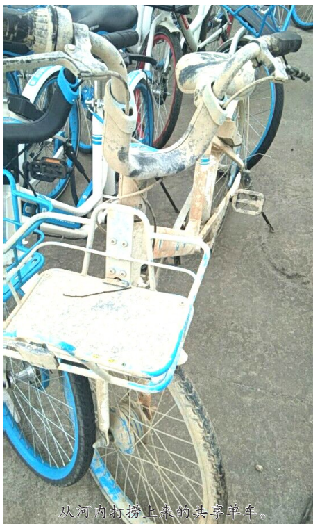
从河内打捞上来的共享单车。