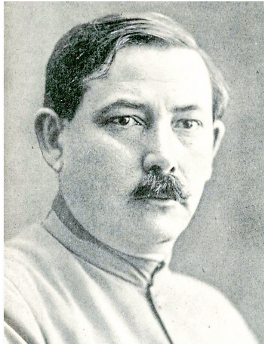
米哈伊尔·马尔科维奇·鲍罗庭